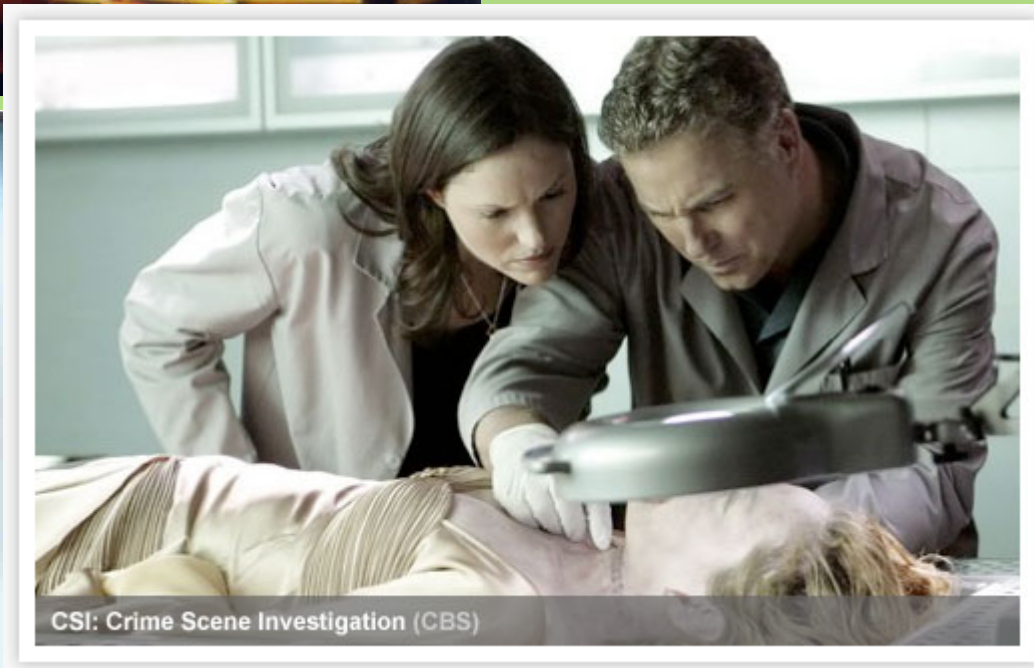
CSI: Crime Scene Investigation (CBS)